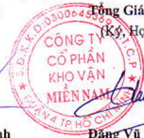
Đặng Vũ Thành