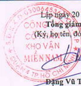
Đặng Vũ Thành